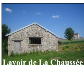
Lavoir de La Chaussée