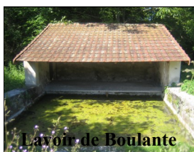
Lavoir de Boulante