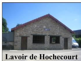
Lavoir de Hochecourt